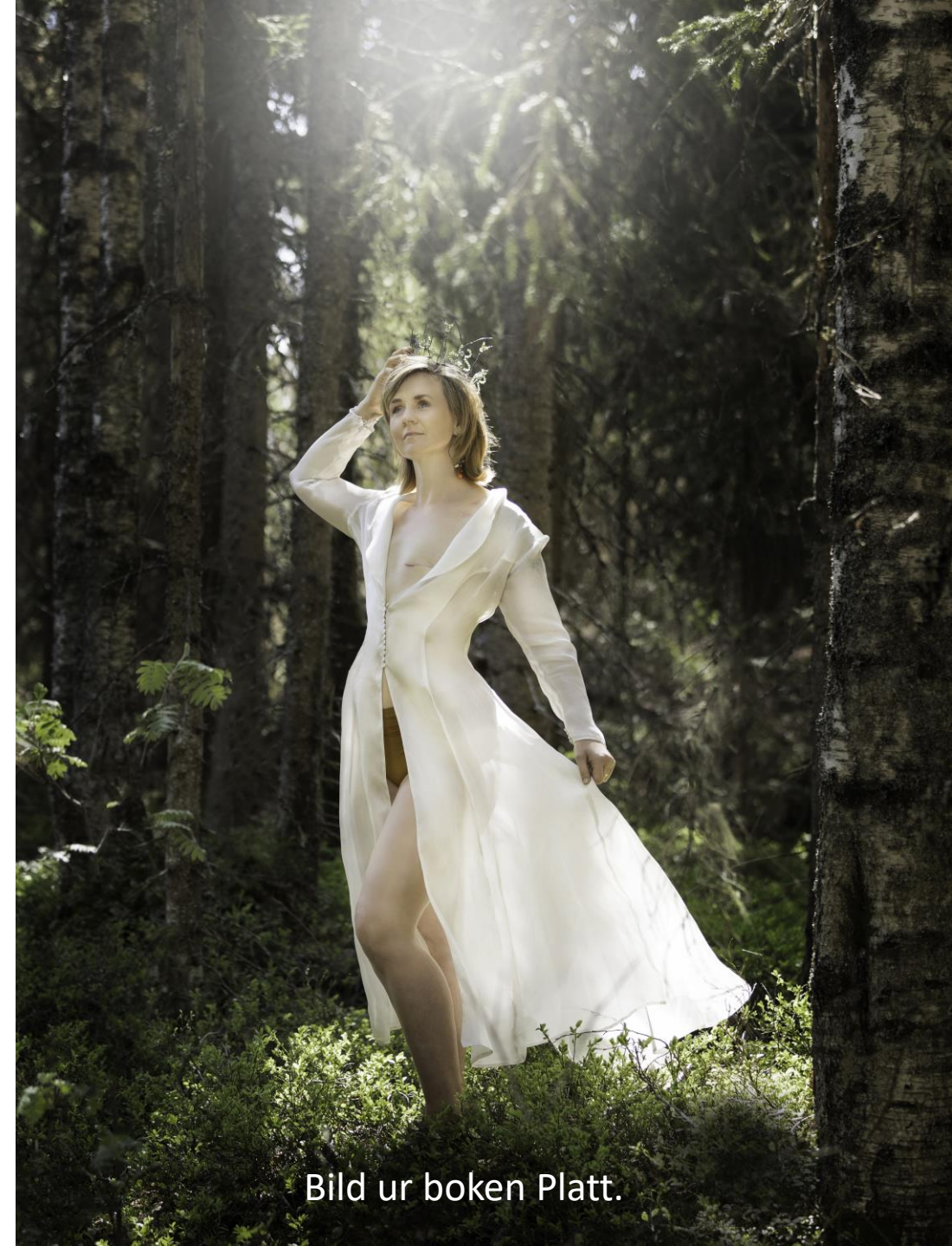
Bild ur boken Platt.