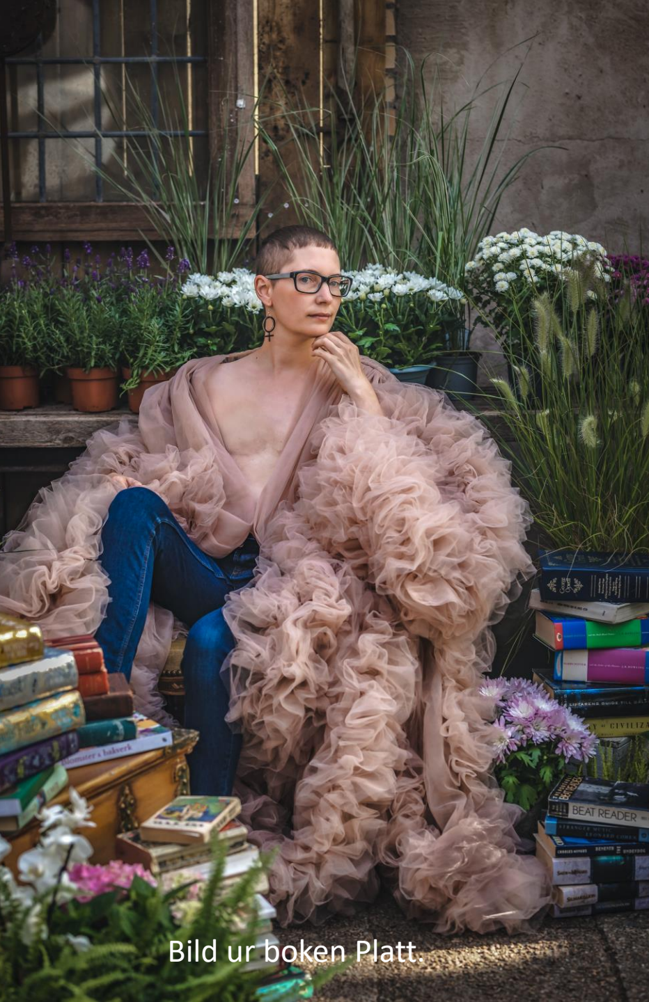
Bild ur boken Platt.

Vårdens mål mäts i antal bröstbevarande operationer och antal direktrekonstruktioner.