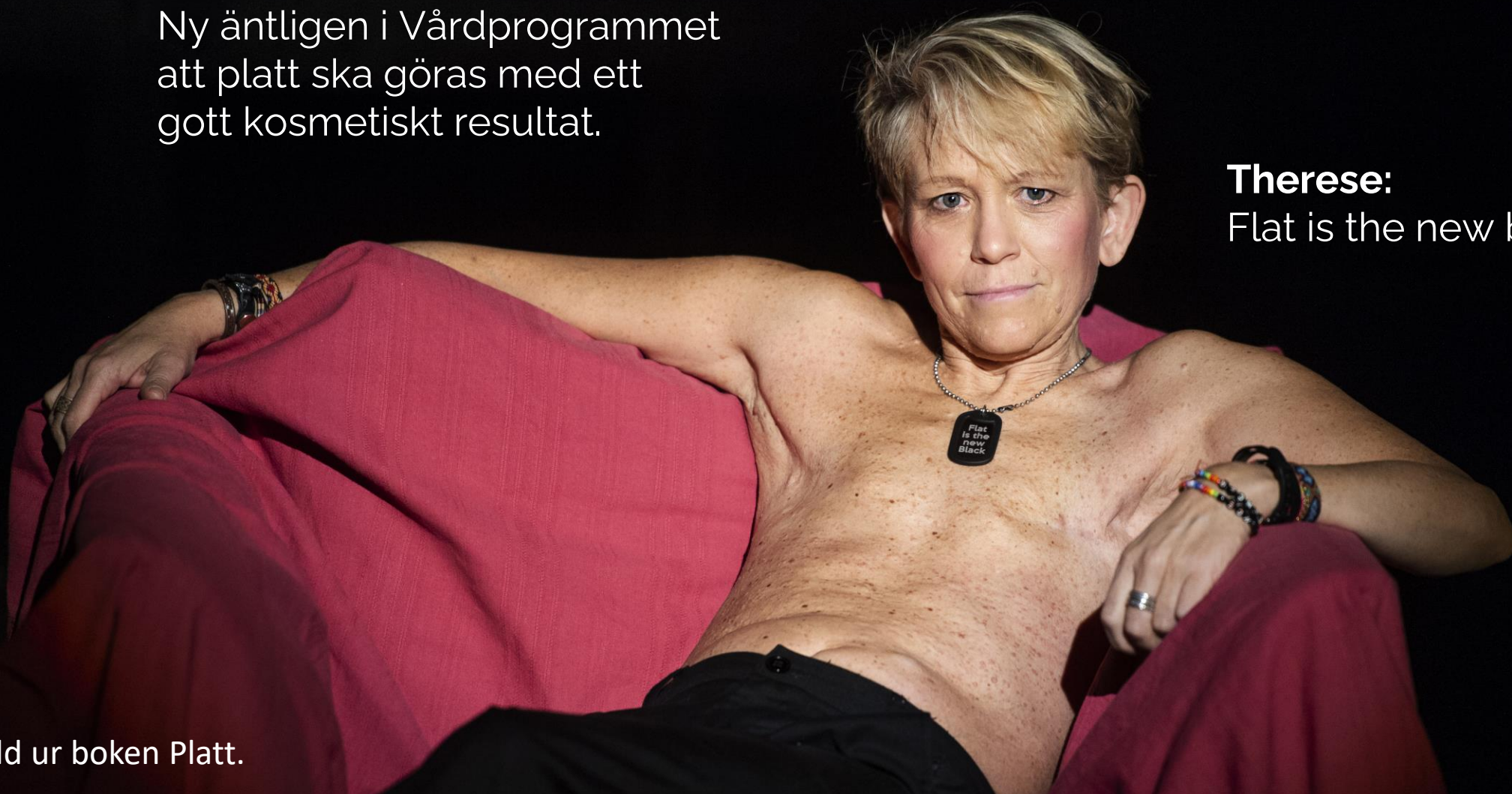
Bild ur boken Platt.