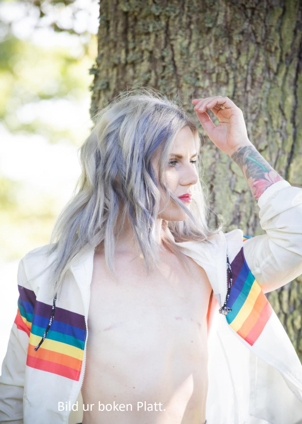
Bild ur boken Platt.